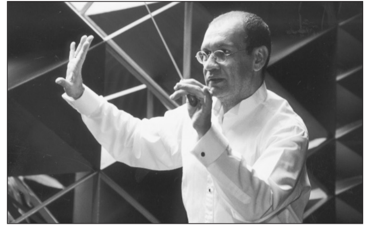
Esta noche inaugurará el II Encuentro Internacional de Salsa con la presencia del músico Andy Durán

—Es una reflexión crítica, porque creo que en el fondo toda historia es inventada. Hay quienes pretenden que la historia es científica, una ciencia social, pero estoy convencido de que no es así. Y lo vemos a diario, es difícil determinar la verdad. Hace tres años las tropas estadounidenses llegaron a Irak, en eso todo el mundo coincide. La mitad del mundo piensa que fueron a liberarlos, el resto habla de invasión. La historia la escribirán quienes de aquí a 100 años dominen.