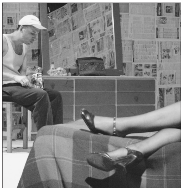
Lluvia en el Raval, de la agrupación española Segundo Viento, abrió la cita teatral

Hoy, el teatro de PDVSA, en Guaraguao, será el escenario de Un singular baño de hombres , a cargo del grupo anzoatiguense Puertoteatro. Igualmente, el grupo Proyecto Azul presentará